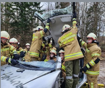
Übung - Verkehrsunfall