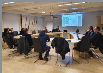
Planungsausschuss der FF Hallwang