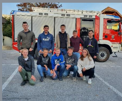
Gruppenfoto bei 1. Übung