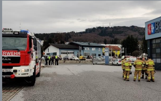
Brandverdacht Wiener Bundesstraße in Esch