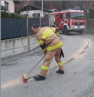
Dieselaustritt aus LKW