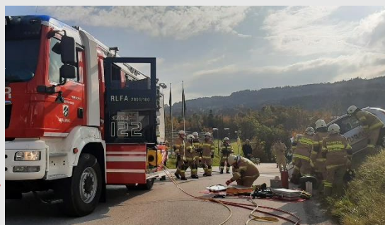
Rechtes Bild: Herbstübung Übungsabschnitt „Verkehrsunfall“