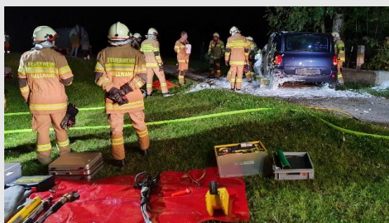
Linkes Bild: Zugsübung Verkehrsunfall - PKW gegen Hausmauer

Im Bereich der Kameradschaftspflege und den feuerwehreigenen Veranstaltungen waren noch keine großen Sprünge möglich. Allem voran musste im Februar 2022 zum zweiten Mal hintereinander auf die Durchführung des traditionellen Feuerwehrballes verzichtet werden.