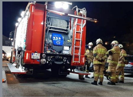
Gruppenübungen – Fahrzeugkunde