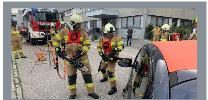
Simulierte Menschenrettung an einem Unfallfahrzeug

Unter den strengen Augen der Bewerter und natürlich unter Einhaltung der zu diesem Zeitpunkt gültigen Corona-Richtlinien konnten alle Prüflinge der Feuerwehr Hallwang diese Aufgabe meistern und das technische Leistungsabzeichen in Silber entgegennehmen.