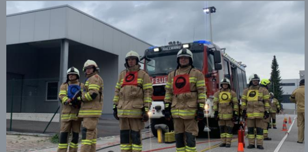
Aufstellung vor dem Rüstlöschfahrzeug