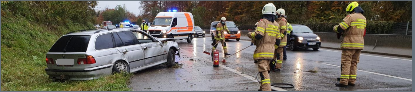
Verkehrsunfall auf der A1 – Aufräumarbeiten nach einem Unfall mit einem PKW