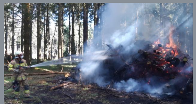
Brand eines Holzlagerplatzes im Grafenholz

Ende März und Anfang April mussten jeweils im Waldbereich zwei Brände gelöscht werden. Im ersten Fall war die Bekämpfung eines Flächenbrandes im Hammerholz notwendig. Bei der zweiten Alarmierung handelte es sich um einen Holzlagerplatz im Grafenholz, der gelöscht werden musste. Durch das rasche Eingreifen der Feuerwehr Hallwang konnte in beiden Fällen eine Brandausbreitung auf größere Bereiche und somit größerer Schaden verhindert werden.