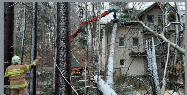
Umgestürzte Bäume müssen von einem Haus entfernt werden

Ende Februar waren nach einer massiven Sturmfront mit Windböen, welche weit über 100km/h erreichten, mehrere Einsätze notwendig. Umgestürzte Bäume mussten von Wohnhäusern und Verkehrswegen entfernt werden. Ein Mehrparteienhaus in Tiefenbach wurde dabei besonders schwer in Mitleidenschaft gezogen. Im Mai musste nach einem Blitzschlag wiederum ein Baum vom Dach eines Wohnhauses im Einleitensweg entfernt werden.