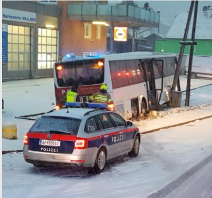
Verkehrsunfall auf der Wiener Bundesstraße mit einem Linienbus