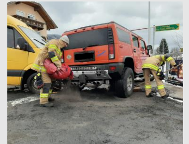
Verkehrsunfall auf der B1 mit zwei Fahrzeugen im Kreuzungsbereich mit der Zillingerstraße

Im Februar ereigneten sich auf der Bundesstraße B1 aufgrund winterlicher Fahrbahnverhältnisse Verkehrsunfälle bei denen ein Eingreifen der Feuerwehr erforderlich war. In allen Fällen konnten die Lenker ihre Fahrzeuge selbstständig verlassen, mussten jedoch vom Roten Kreuz mit leichten Verletzungen in Krankenhäuser gebracht werden. Die Feuerwehr führte Binde- und Aufräumarbeiten durch. Außerdem unterstützte sie die Bergung der teilweise stark beschädigten Unfallfahrzeuge.