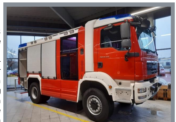
Tank Hallwang im „Rohbau“ (Dezember 2020)

Das Projekt zur Anschaffung eines neuen Tanklöschfahrzeuges geht in die Endphase. Gestartet wurde es bereits Ende 2019. Die Auslieferung und Übergabe sind nun für Anfang März 2021 geplant. Die Beschaffung erfolgt über den Landesfeuerwehrverband Salzburg, wodurch auf eine große Erfahrung bei der Ausschreibung eines Feuerwehrfahrzeuges zurückgegriffen werden konnte. Die Kosten teilen sich die Gemeinde Hallwang und der Landesfeuerwehrverband entsprechend der geltenden Förderrichtlinien. Die Feuerwehr Hallwang plant die Gemeinde mit einem nennenswerten Betrag aus eigenen finanziellen Mitteln beim Ankauf zu unterstützen.