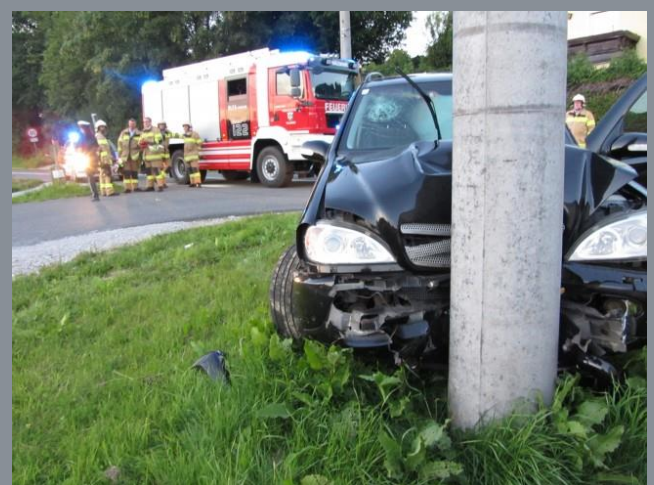
Verkehrsunfall Bundesstraße B1