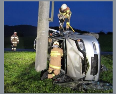
Vielfältiges Übungs- und Ausbildungsprogramm